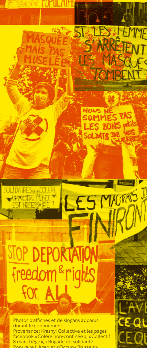
Photos d'affiches et de slogans apparus durant le confinement.